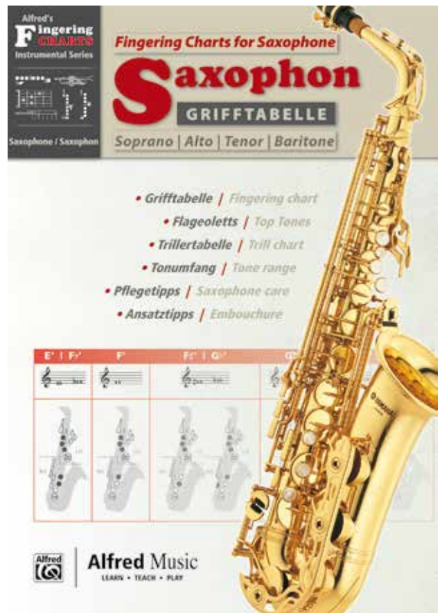
for Soprano | Alto | Tenor | Baritone Saxophone 20229G | ISBN 978-3-943638-63-9