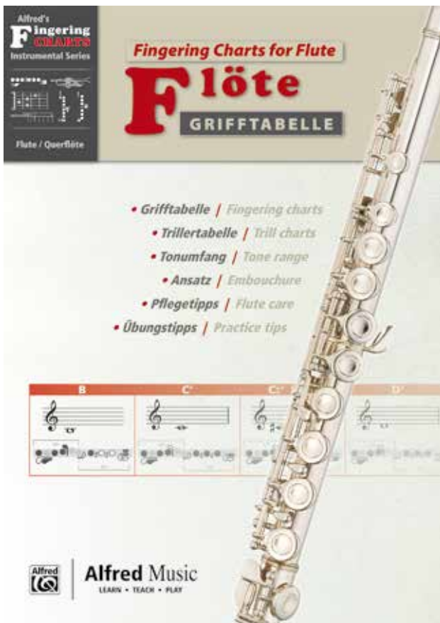
for Flute 20226G | ISBN 978-3-943638-60-8