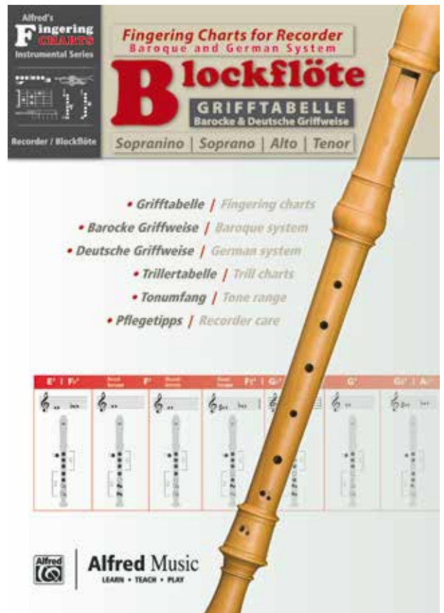
for Sopranino | Soprano | Alto | Tenor Recorder 20232G | ISBN 978-3-943638-66-0