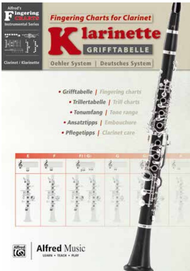
for Clarinet Oehler System 20228G | ISBN 978-3-943638-62-2